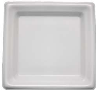
正角皿 19-19 無地ラミ