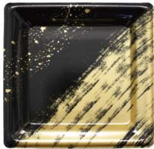
正角皿 19-19 彩流黒 (サイリュウクロ)