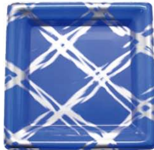
正角皿 19-19 響河 (キョウガ)