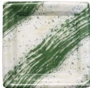
正角皿 19-19 緑香 (リョウコウ)