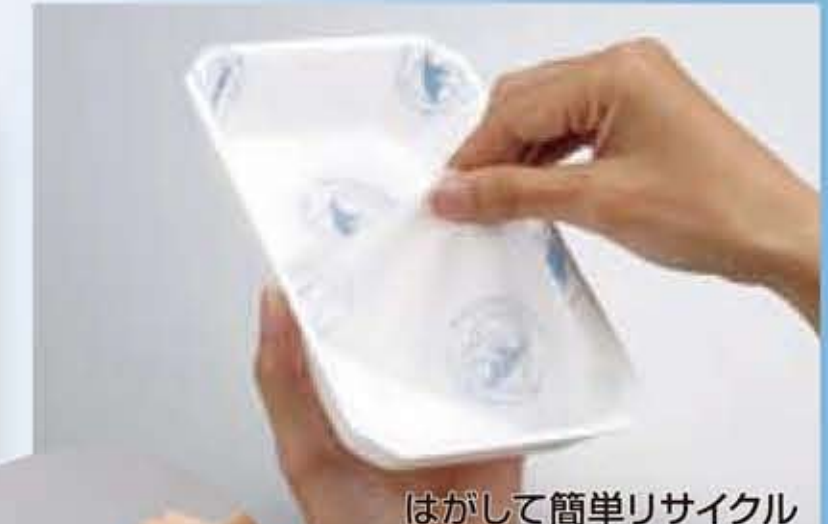
はがして簡単リサイクル

使用後に容器表面フィルムを簡単にはがすことで、家庭で洗わずとも回収利用ができ、廃棄物の減量ができます。環境型社会ニーズにマッチした食品用包装トレーです。